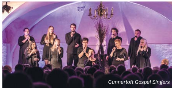
Gunnertoft Gospel Singers

Giv dine venner eller familie en billet i julegave! Billetpriiser og bestilling - se kirkens hjemmeside.